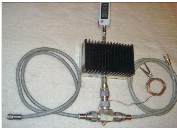
Bild 10: Vorbereiteter Messaufbau beim Autor für den Genauigkeitsvergleich mit einem kommerziellen Funkmessplatz

Bild 10 vermittelt einen Einblick in den sehr sorgfältigen Versuchsaufbau.